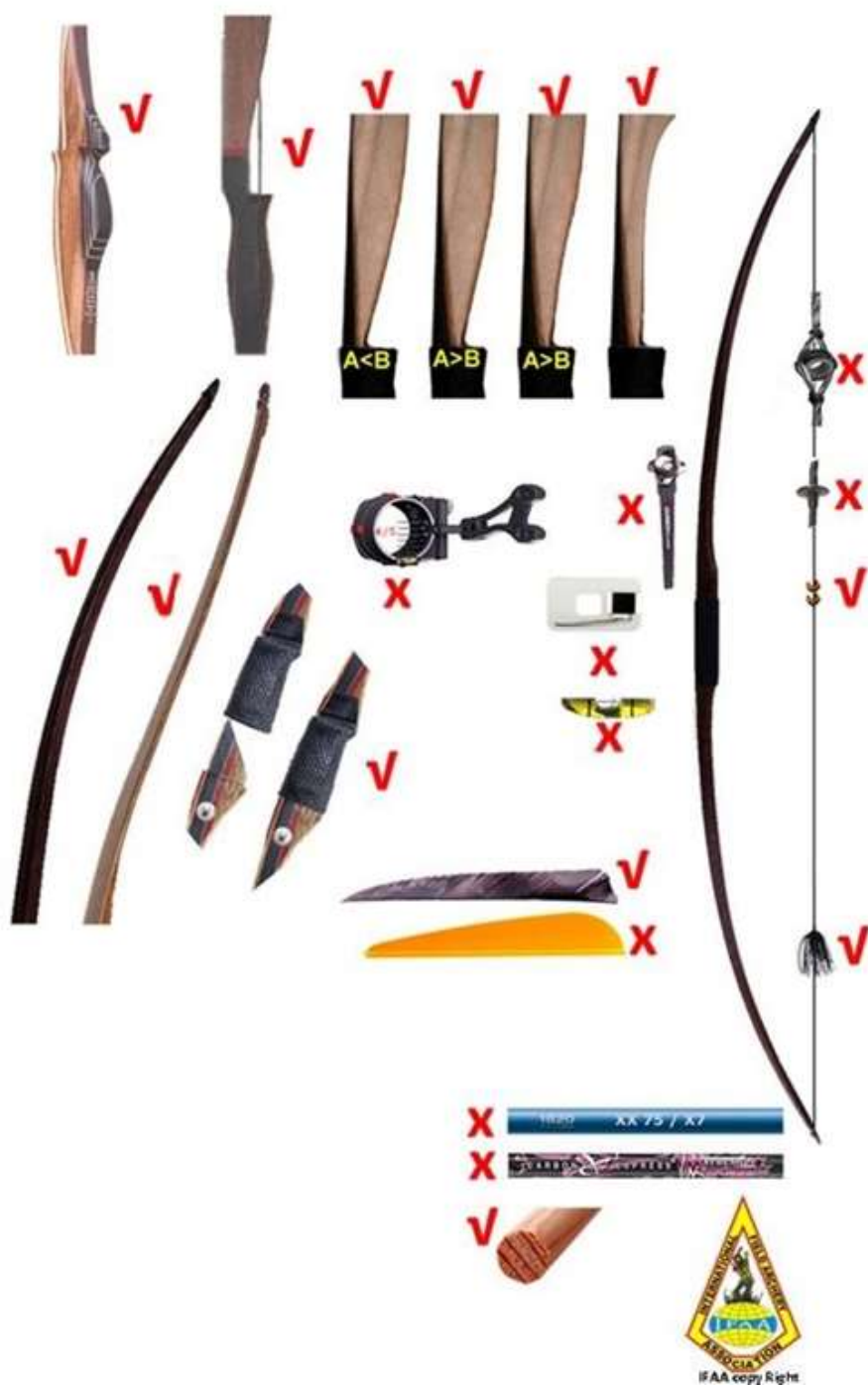
Rys. 3. LP na podstawie materiałów IFAA

LP - Łuki z półką: jednoczęściowe i składane łuki kompozytowe, z oknem i/lub półką dowolnej głębokości, posiadające chwyt pistoletowy, strzały drewniane z lotkami z materiałów naturalnych (papier, pióro, pergamin, itp.), osady z materiałów dowolnych, cięciwy z materiałów dowolnych. Łuki mogą mieć proste i nieregulowane podstawki pod strzałę w dowolnej formie (plastik, metal, szczecina, włosie, skórka, itp.), zabronione są owijki wplecione w cięciwę, dopuszczony jedynie siodełko lub bączek na cięciwie oraz tłumiki cięciwy umieszczone w odległości minimum 305 mm powyżej i poniżej siodełka/bączka.