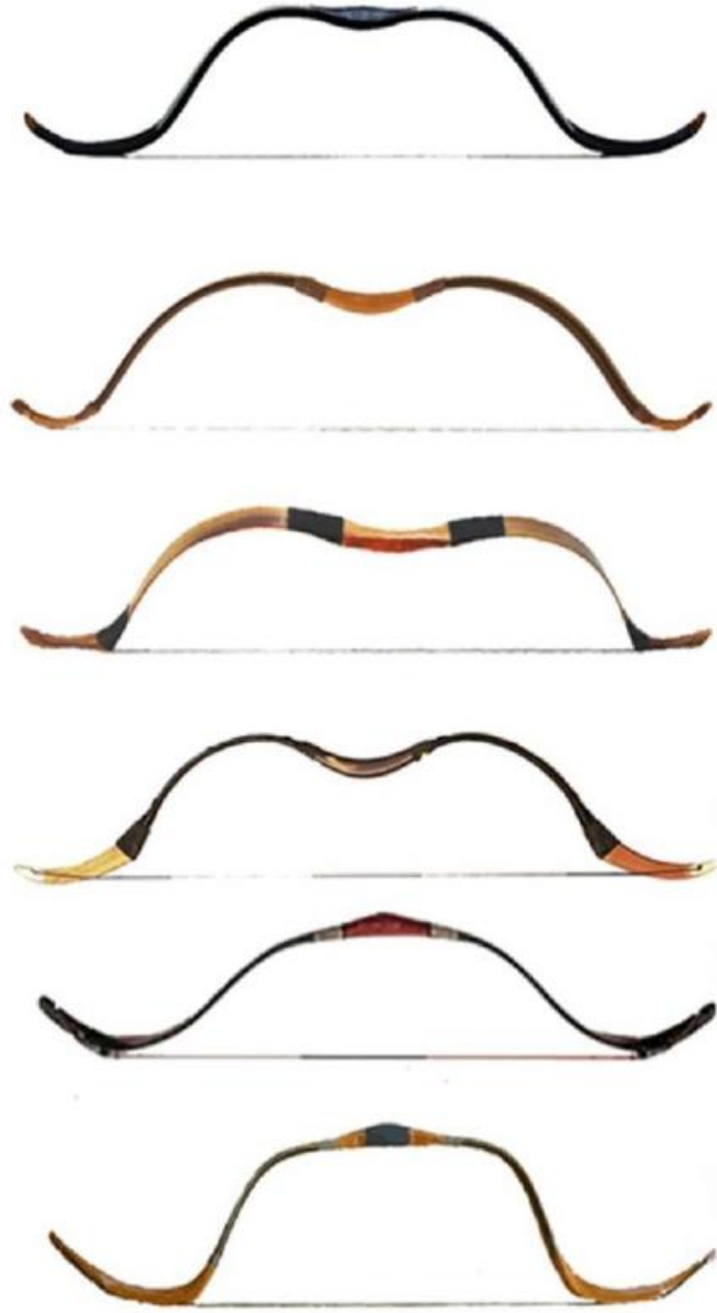
VARIOUS TYPES OF HORSE BOWS